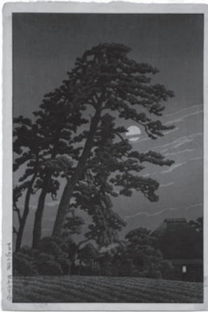
“Moon at Magome”, from the series “Twenty Scenes of Tokyo” na kinunan noong 1930

Si Hasui Kawase ay isang pintor na nanirahan ng mahabang panahon at namuhat sa pagpipinta sa Ota City. Nilakbay ni Hasui Kawase ang buong Japan at iginuhit ang mga tanawin sa bawat lugar sa bawat panahon. Sinasabing higit sa 600 na gawa ang kanyang naiguhit sa kanyang buong buhay. Sa espesyal na eksibisyon na ito, i-didisplay namin ang kanyang mga sketchbook, diary, paboritong bagay, larawan, atbp. nang magkahiwalay, sa una at pangalawa hati, kasama na ang mga gawa niya mula sa kanyang unang taon hanggang sa kanyang mga huling taon. Sa unang hati, pangunahing ipapakita ang mga tanawin sa “Tokyo”, kung saan ang lugar ng kapanganakan din ni Hasui at kung saan siya ay mayroong emotional attachment, at sa pangalawang hati naman ay ipapakita ang mga tanawin ng mga “patutunguhan” na mga binisita ni Hasui na mahilig maglakbay.