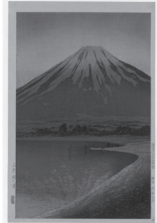
“Dawn at Lake Yamanaka” na kinunan noong Agosto 1931

Mangyaring tingnan ang mga magagandang tanawin sa Japan na kinunan ni Hasui Kawase.